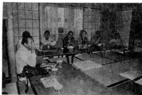
熱心に話し合う参加者

今は、透析技術も進んで成績もよくなりましたが、それでも自分でノートにつけることは大事ではないでしょうか。病院で検査する各種の検査結果も知ってお