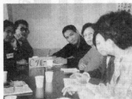
熱心に話し合われた交流会

と思います。私も五十三歳で透析生活に入りましたが、六十歳代になつても、その歳なりに元気でいられるような明るい気持ちになりました。今のデータを守り、明るく生きて行く自信がつかました。ありがとうございます。