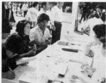
次々と腎バンクに登録 (10・16)