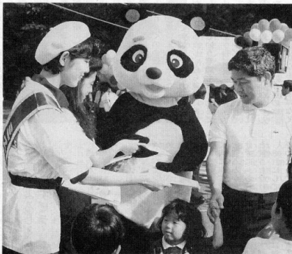
ミス東京が上野公園を訪れた人々に腎・バンク、アイ・バンクの登録を呼びかけた(10月16日)