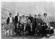
大湧谷で記念写真を

昼食を済ませて箱根町から桃源台まで観光船に乗り、芦の湖を眺めながらすがすがしい秋の風を心に吸い込みました。