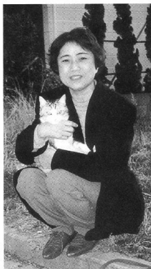
読売ランドで巨人の練習を見るのが楽しみ