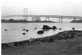
台場からのレインボーブリッジ

しとしとと秋雨の日がつづいていますが、本日はというのと、午前中は雨で、午後から徐々に晴れてきました。「じゃ、撮影行こうか」と、ゆりかもめが待つ新橋駅に向かいます。ここか