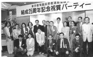
透析20年以上の参加者壇上へ

また、競馬、マジック・歌謡ショー、カラオケなどは私自身も楽しめましたし、出演した方々も輝いて見えました。どの方もそれぞれに悩みを抱えていることでしょ。保険法改悪、臓器移植など、