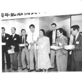
20年以上の会員を表彰