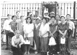
楽しかったバス旅行でした

二四人乗りのバスが一杯となった二人が参加、午前八時半、病院前を出発し、真鶴に向かいました。途中混雑もなく、予約した時