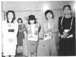
夢競馬で牝馬になった皆さん。お疲れさま。