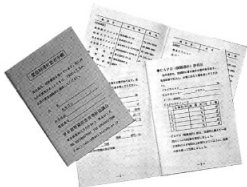
表紙とCAPD患者用と透析施設名簿

東腎協では一九九五年一二月、災害対策意識調査を実施、翌一九九六年三月に、その調査結果とともに、全腎協作成の「災害対策マニュアル」、「防災の手引き」を