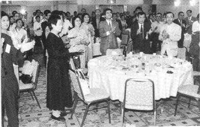
25周年を参加者全員で祝う