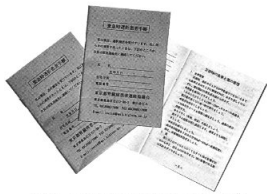
「手帳」の表紙と食事と薬の管理（5ページ）

このうち、「ブロック別透析施設名簿」は会員に好評で、各会員に配布してほしいとの要望が多数ありました。以前より透析施設名簿が欲しいという要望はありましたが、施設の把握、発行費用などの問題もあって、先送りとなっていました。