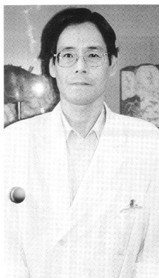
透析を始めた時、2年と言われました