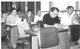
地域腎友会交流会