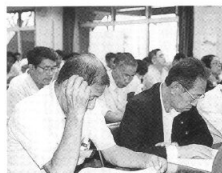
熱心に討議する仲間