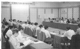
通院介護支援事業交流会