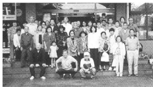
立川北口駅前阿友会