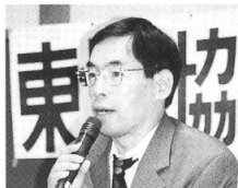
あいさつする糸賀会長