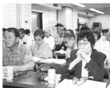
熱心に討議する仲間