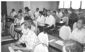
多摩部学習交流会