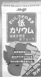
1箱当たりのカリウム量の比較 (当社分析値)

原料名 野菜汁(にんじん、ほうれんそう、トマト) 果汁(りんご、オレンジ) はちみつ、炭酸カルシウム、香料