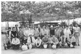
織本病院腎友会の秋の日帰り旅行の皆さん