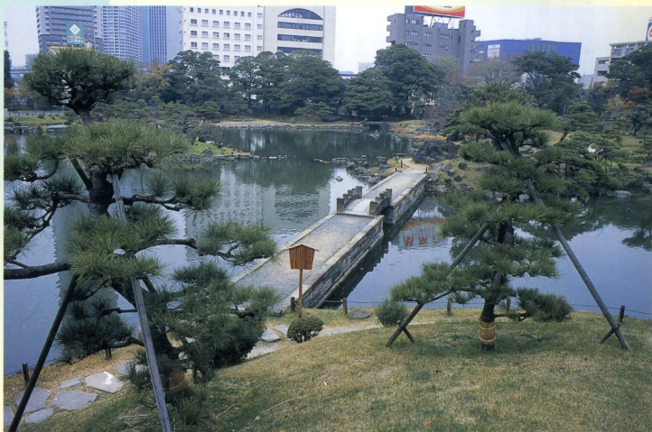
旧芝離宮恩賜庭園