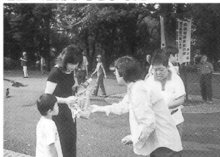
臓器移植キャンペーン