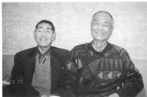
原東腎協副会長(左)と石川会長(右)