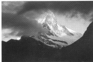
早朝のマッターホルン、残月とともに

マット（1620m）に7泊し、マッターホルン（4478m）の周辺を歩き廻りました。快晴のお花畑の高原を三脚をかついで歩き、マッターホルンや花の写真を撮るのは楽しいものです。