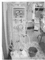
リビングの風景に馴染んでいる透析装置

水質（ETの除去）に限界があるなどの問題もありますが、だからといって在宅透析をやらないということにはなりません。