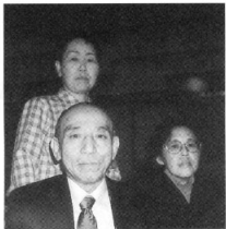
旧牧田友の会のメンバーと

東腎協結成30周年記念祝賀会で新宿へ来たのも久し振りでですが、旧牧田友の会の会員の人達と会うのも久し振りで。牧田友の会は役員が居ないため残念ながら閉会になってしまいました。その後、一部の旧会員の人達と「仲間の会」を作り個人会員として電話や手紙などで近況報告をしたり、