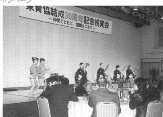
アトラクションを楽しむ