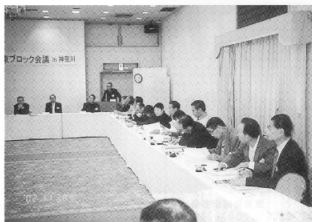
関東ブロック会議神奈川県川崎で