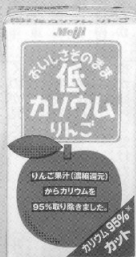
1箱当たりのカリウム量の比較 (当社分析値)